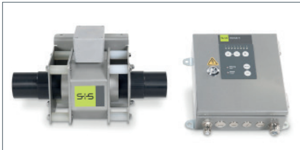
Ejemplo: P-SCAN RP 60 con unidad de montaje y tubo detector.*